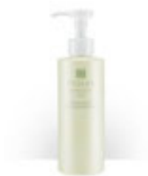
<クレンジングミルク> 200ml ¥5,500+税