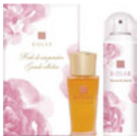
ユイル ドゥ ソワン プルミエール グランコレクション2017 2品セット ¥11,000+税 ◆ムースド ポーテ(美容化粧水)60g ◆ユイル ドゥ ソワン プルミエール(美容オイル)30ml

炭酸泡になって新登場！（※昨年まではミストでした） ◆ムースド ポーテ：導入美容液として使える美容化粧水。濃密な炭酸泡が素早くなじみ、肌を柔らかく滑らかに整えます。